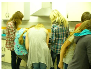
Viele Köche ....

Und hier noch die Lieblingsbilder unserer Lehrerin: